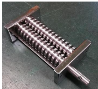
切刃ロールユニット